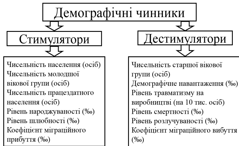
Рис. 2. Розподіл демографічних чинників, що впливають на відтворення трудового потенціалу