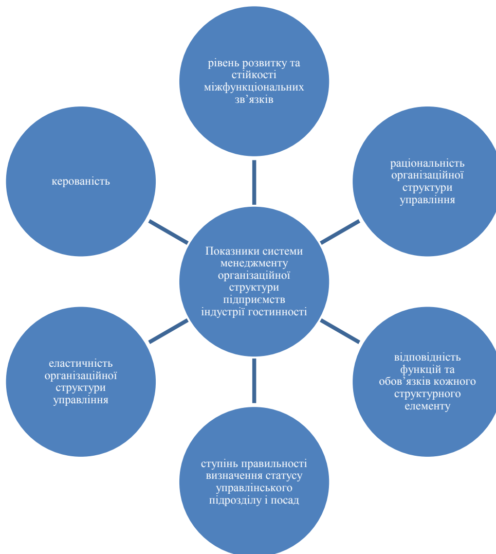
Рис. 1. Показники системи менеджменту організаційної структури підприємств індустрії гостинності