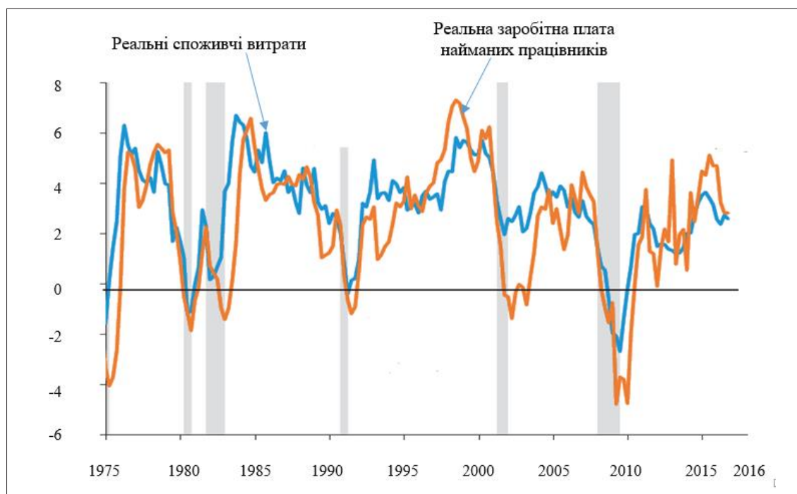
Рис. 2. Щорічні темпи зростання реальної заробітної плати найманих працівників і реальних споживчих витрат домогосподарств США у 1975–2016 рр., % [5]

Не слід скидати з рахунків і тієї надважливої ролі, що відіграють Сполучені Штати Америки у глобальній політиці, економіці та безпеці, що дає їм додаткові переваги в отриманні доступу на зарубіжні ринки та широкі можливості захищати на них інтереси своїх транснаціональних структур. Так, частка внутрішнього виробництва США, залученого в експортні операції, збільшилась із 9% у 1929 р. до 21% на початку XXI ст., при цьому високотехнологічні галузі американської економіки спрямовують на експорт понад 25% виробленої продукції [9]. Як свідчать дані, представлені в табл. 1, у 1870–2016 рр. зовнішньоторговельний обіг товарів держави збільшився з 829 млн. до майже 3,7 трлн. дол. США (зокрема, товарний експорт збіль-