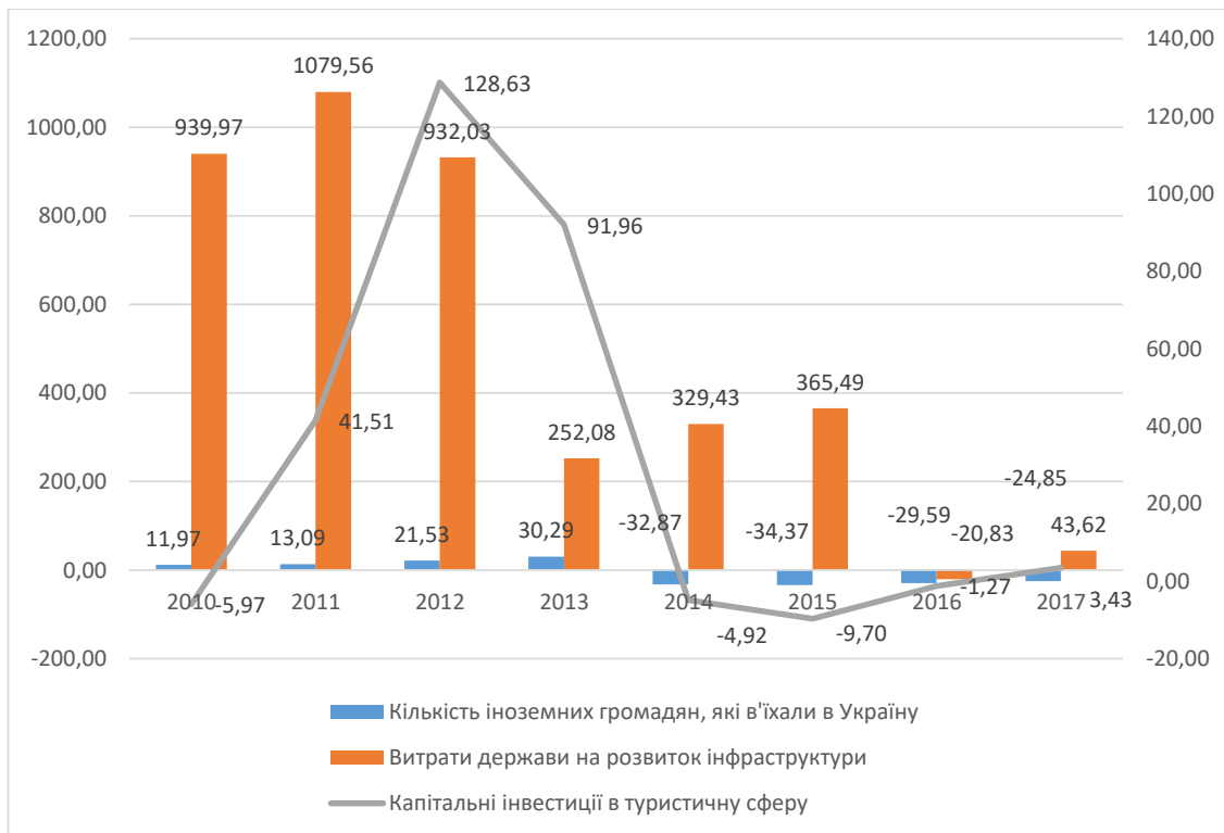
Рис. 1. Темп приросту кількості іноземних громадян, які в'їхали в Україну, витрат держави на розвиток інфраструктури, капітальних інвестицій в туристичну сферу

Темп приросту кількості колективних засобів розміщення з 2014 р. суттєво зменшився й не відповідає постійно зростаючій потребі туристичного ринку.