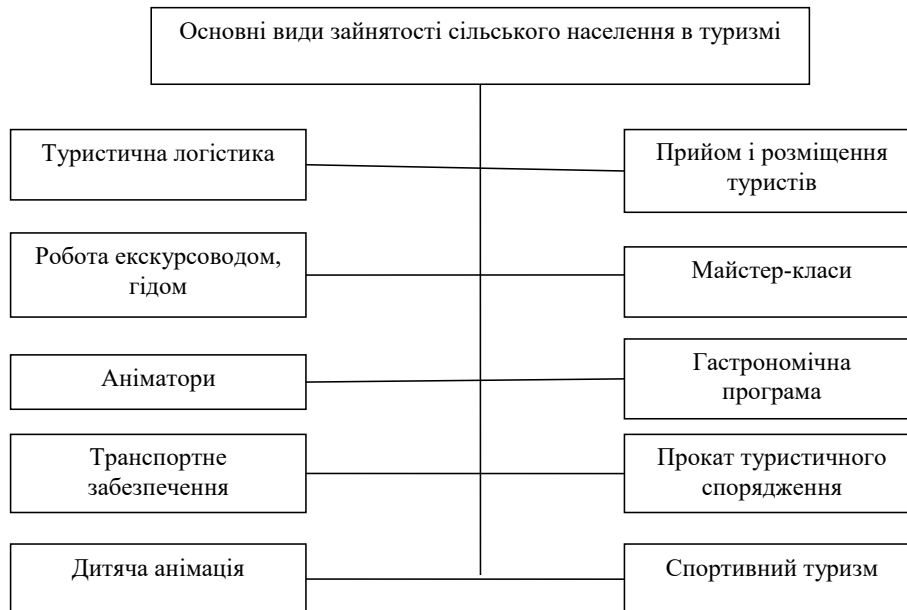
Рис. 2. Основні види зайнятості сільського населення у туризмі

послуг туристам і реалізації вироблених продуктів харчування за доступними цінами; в) поліпшенню благоустрою сіл, облаштування окремих садиб; г) відродженню місцевих народних звичаїв, промислів, кулінарних традицій; д) збереженню і відновленню місцевої історико-архітектурної спадщини, українських садиб із клунями, стодолами, шопами, вітражами тощо.