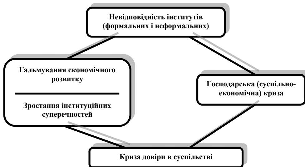
Рис. 1. Ситуація невідповідності якості економічного розвитку для емерджентних систем

Висновки. Прогресивною бажаною платформою реалізації стабільної, результативної та фінансово-спроможної вітчизняної системи соціального забезпечення в сучасних умовах військової агресії та оцінки закордонного досвіду надання соціальних послуг (зокрема, європейського) є економічне підтримання на базі концепції усталеного розвитку з комплексним поєднанням економічної, соціальної та екологічної його складових. Ситуаційними умовами і ендегенними факторами забезпечення реалізації даної концепції в Україні є припинення бойових дій, процеси реформування інституту власності, орієнтування економіки на