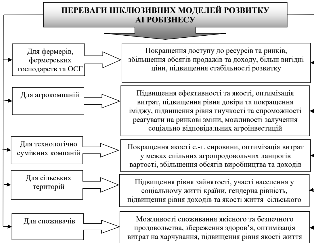
Рис. 1. Переваги інклюзивних моделей агробізнесу для учасників агропродовольчих ланцюгів вартості