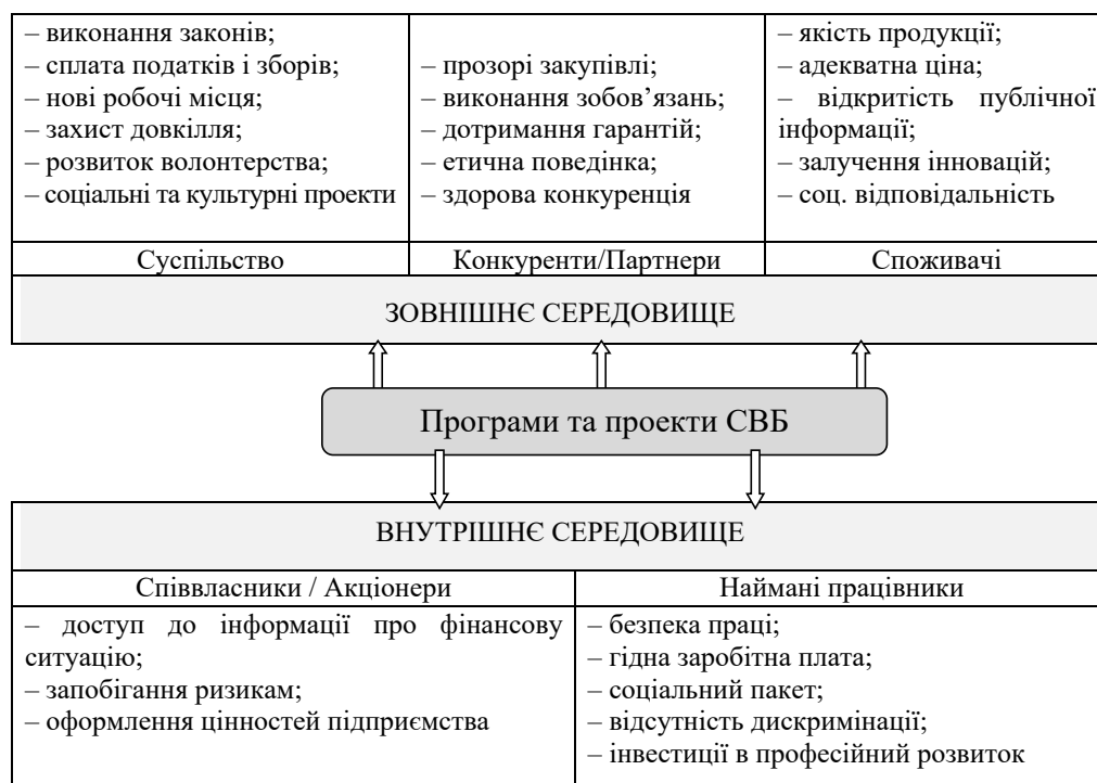
Рис. 2. Схема реалізації СВБ в європейських моделях соціальної відповідальності з кінцевими бенефіціарами