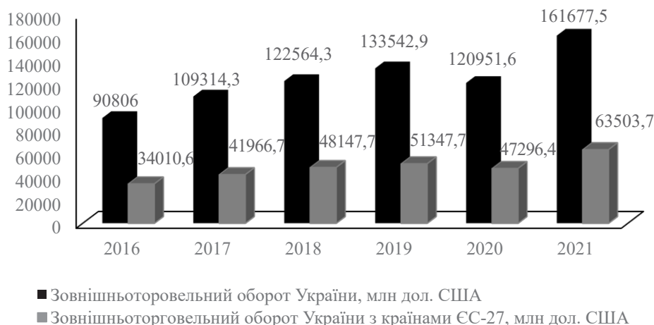
Рис. 1. Динаміка зовнішньоторговельного обороту України у 2016–2021 роках, млн дол. США