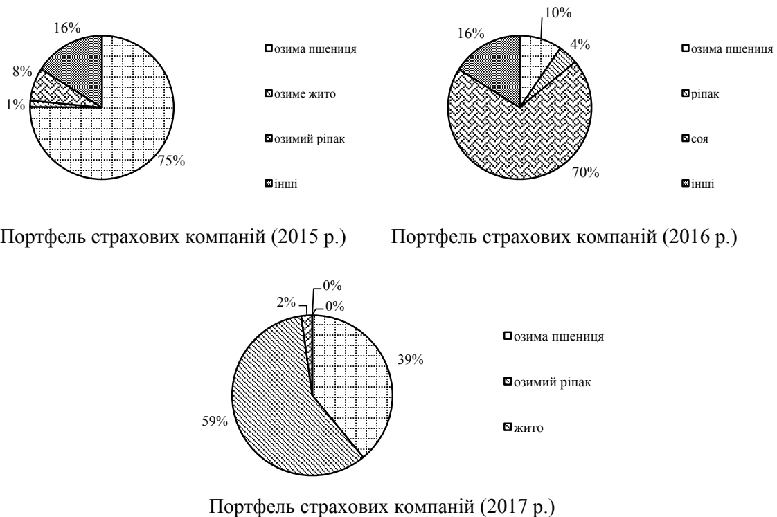
Рис. 1. Структура страхового портфеля агрострахування

Портфель страхових компаній (рис. 1) включає страхові платежі із щорічного страхування посівів і врожаю таких сільськогосподарських культур, як озима пшениця (75% – у 2015 р., 10% – у 2016 р. та 39% – у 2017 р.), озимий ріпак (8% – 2015 р., 4% – 2016 р., 59% – 2017 р.), озиме жито (1% – 2015 р., 2% – 2017 р.), соя (70% – у 2016 р.) та ін.