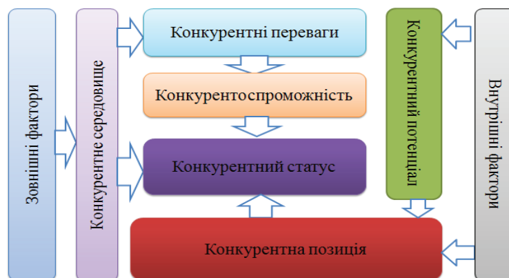
Рис. 2. Структурно-логічна схема єдності понять «конкурентні переваги», «конкурентний потенціал», «конкурентна позиція» аграрного сектору економіки

В подальших наукових дослідженнях планується зробити спробу сформувати дієвий механізм забезпечення конкурентних переваг, який може вміщувати в себе окремі елементи організаційного, стимулюючого, підтримуючого та результируючого впливу, кожен з яких має свої методи досягнення конкурентних переваг аграрного сектору економіки в умовах глобалізації. Такий механізм має на меті сприяти формуванню конкурентних переваг регіонів України з метою покращення або ж підтримання свого конкурентного статусу.