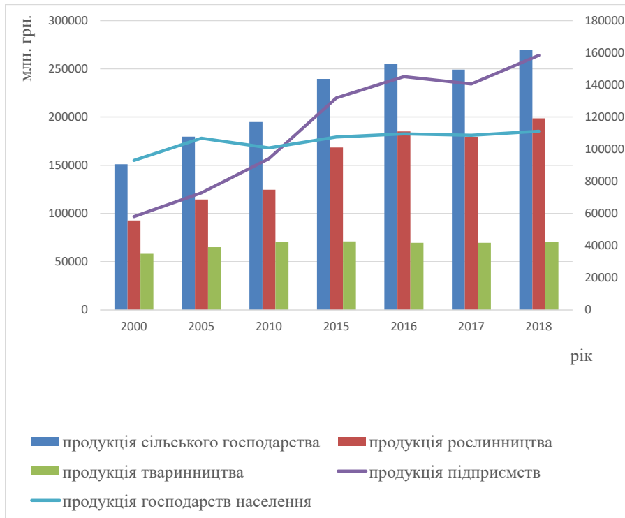
Рис. 1. Динаміка виробництва продукції аграрних підприємств України за 2000–2018 рр. у постійних цінах 2010 р.