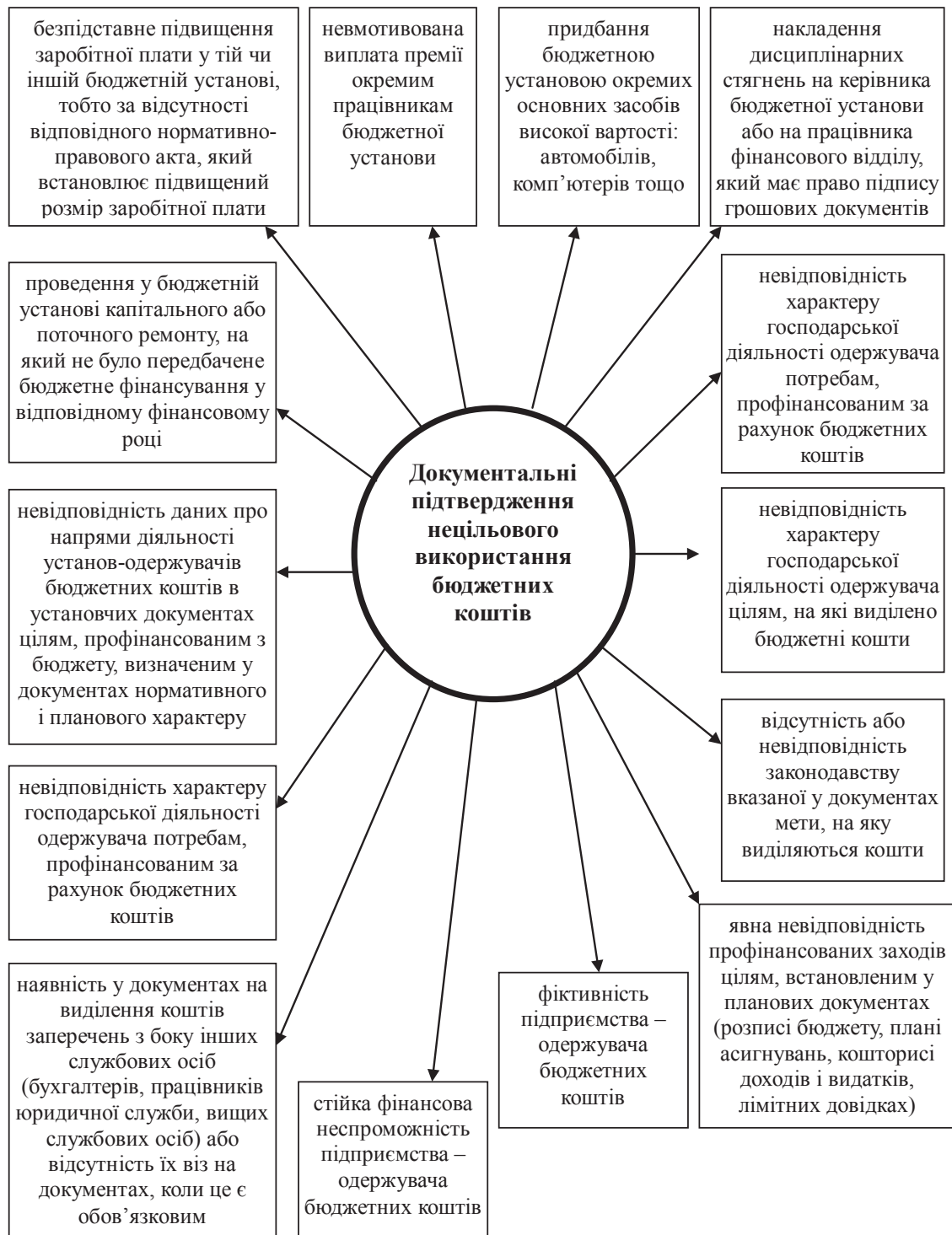
Рис. 3. Документальні факти, які вказують на нецільове використання бюджетних коштів

оподаткування, банківської і комерційної діяльності, специфіки технологій виробництва, аналізу тощо.