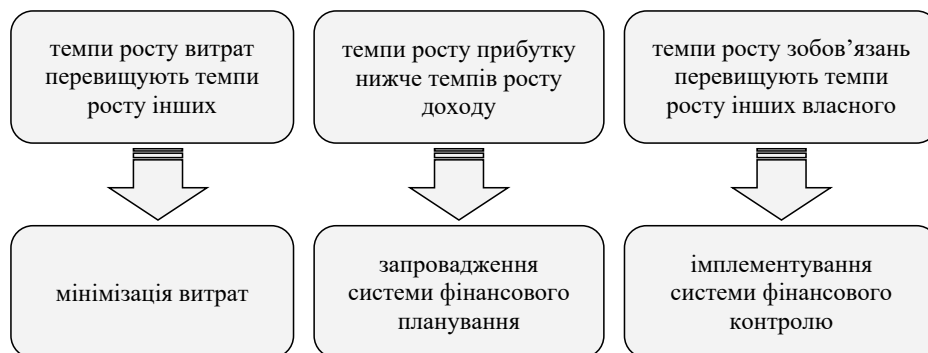
Рис. 2. Приклади фінансових проблем та шляхи їх усунення