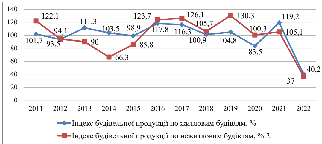
Рис. 2. Індеси будівельної продукції по житловим будівлям у 2011–2022 роках, % до попереднього року